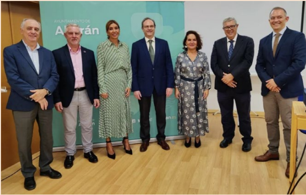
Imagen tomada el día de la jornada

El pasado 7 de octubre de 2022, en el final de la jornada sobre Nutrición y Riesgo Vascular que se realizó en Albarán (Murcia), se procedió a la aprobación de las actas de constitución de la Sociedad Española de Farmacéuticos Nutricionistas, a la presentación de la junta directiva, de los objetivos, estructuras y estatutos.